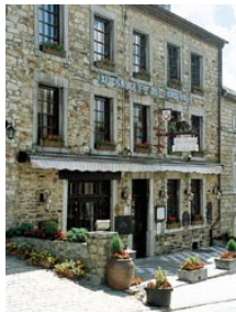
Au Sanglier des Ardennes is een rustiek, familiaal hotel/restaurant in het centrum van Oignies.